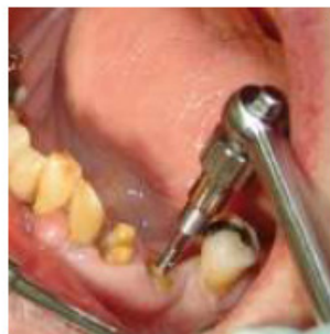
PASSO 2 Inserção do extrator de raiz com o auxílio de carraca