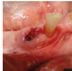
PASSO 6 Alvéolo preservado