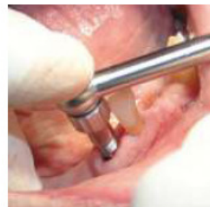
PASSO 3 Possibilidade de utilizar prolongador para extrator de raízes