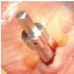
PASSO 4 Posição final do extrator