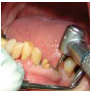
PASSO 1 Perfuração da raiz com broca piloto

Descomplique as suas práticas clínicas e garanta a completa satisfação do seu paciente em 6 passos: