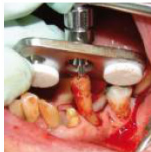
PASSO 5 Retirada da raiz com auxílio da placa niveladora apoiada nos dentes laterais